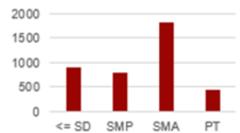
Tabel 2. Persentase Penduduk Menurut Pendidikan di Desa A Tahun 2024