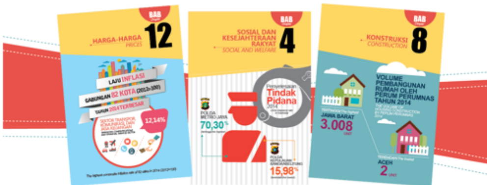
Infografis Sebagai Pembatas Bab Buku