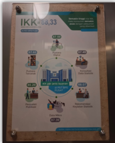
Infografis sebagai Poster yang ditempel di dinding